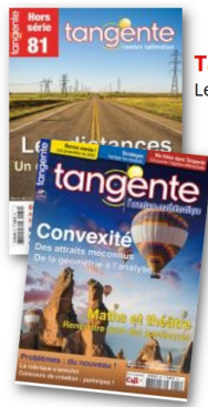
Tangente HS 81 Les distances