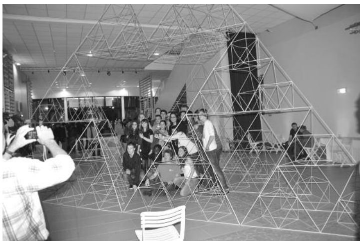
Une photo d'un tétraèdre de Sierpinski géant construit à Poitiers lors des « Rencontres CNRS Jeunes Sciences et Citoyens » en novembre 2010.

Les secondes étaient différenciées. En mathématiques, on était en plein « bourbakisme ». Dans la section C (maths), difficile, dix à vingt élèves selon les années obtenaient leur bac à Bobigny (les effectifs des « options maths » sont plus faibles actuellement). Un élève sur deux redoublait ce qui faisait des taux de réussite de l'ordre de 65 % car rares étaient ceux qui ne l'avaient pas au deuxième essai. En section D (SVT), les échecs étaient plus nombreux. Dès cette époque, de très bons élèves partaient à Paris, ou au lycée privé voisin pour les filles. Cependant, les classes étaient moins homogènes socialement qu'aujourd'hui, on y voyait encore quelques rares enfants de cadres ou d'enseignants.