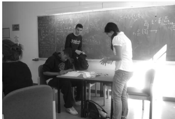
Séance de travail lors du stage « Zéro en maths » pendant les vacances de printemps à l'IHP.

Cependant, elles ont rencontré un indéniable succès là où elles se sont développées, suscitant l'enthousiasme des enseignants concernés (comme au sein de MATH.en.JEANS), et des élèves qui y ont participé.