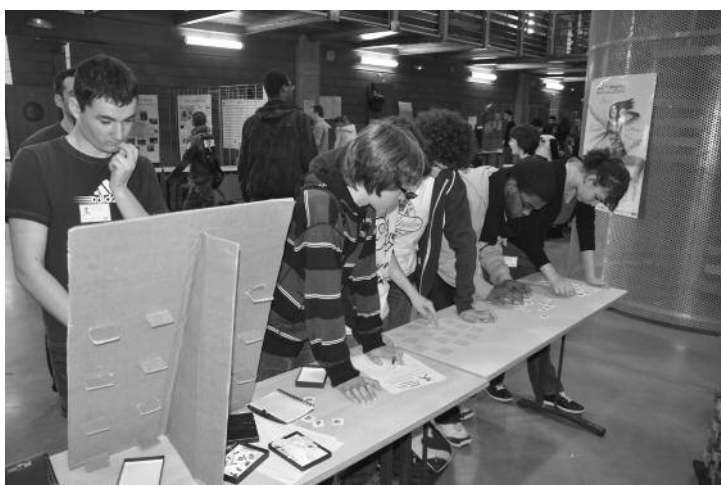
Animation sur les carrés gréco-latins au Congrès MATH.en.JEANS à Bobigny.

Les secondes étaient différenciées. En mathématiques, on était en plein « bourbakisme ». Dans la section C (maths), difficile, dix à vingt élèves selon les années obtenaient leur bac à Bobigny (les effectifs des « options maths » sont plus faibles actuellement). Un élève sur deux redoublait ce qui faisait des taux de réussite de l'ordre de 65 % car rares étaient ceux qui ne l'avaient pas au deuxième essai. En section D (SVT), les échecs étaient plus nombreux. Dès cette époque, de très bons élèves partaient à Paris, ou au lycée privé voisin pour les filles. Cependant, les classes étaient moins homogènes socialement qu'aujourd'hui, on y voyait encore quelques rares enfants de cadres ou d'enseignants.