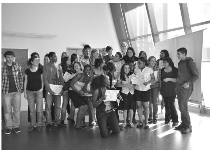
Remise des diplômes aux élèves de fin de seconde de l'Université d'été Science Ouverte à Paris 13.

Il arrive parfois que des situations changent de façon souterraine, que de nouveaux courants apparaissent, perceptibles seulement par un regard rétrospectif. Six ans après novembre 2005, si les banlieues ne font plus la une de l'actualité, la Seine-Saint-Denis où j'ai enseigné trente ans et où j'habite toujours, ne fait apparaître à mes yeux que la continuation des tendances qui ont prélué à l'explosion.