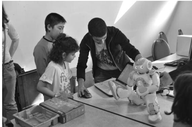
Présentation du petit robot Nao à Drancy en mars 2011.

Elles ont apporté du nouveau parce que non contraintes par les programmes et ne débouchant pas sur des notes. Elles ont